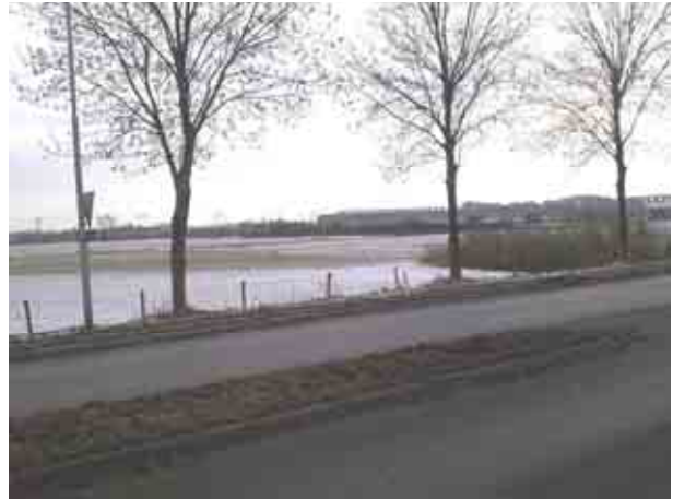
Ligging Haven Hedel