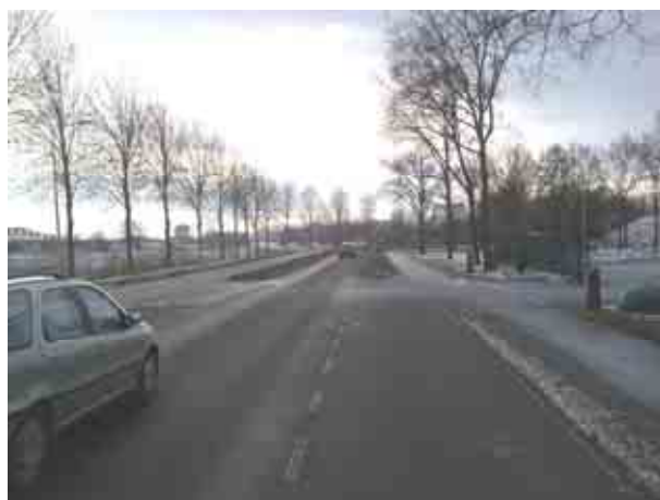
Maasdijk ter hoogte van aansluiting haventerrein

Uitgaande van goede zichtrelaties worden op de nieuw te realiseren aansluiting geen verkeersveiligheidsproblemen verwacht. Ook de aansluitingen van de provincialeweg op de Oude Rijksweg zijn thans zodanig ingericht dat de verkeersveiligheid niet in gevaar komt bij de verwachte toename van het vrachtverkeer Haven Hedel. Een situatie waarbij het vrachtverkeer sterk conflicteert met het recreatieverkeer wordt niet verwacht.